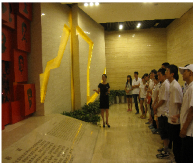
参观八路军兰州办事处纪念馆