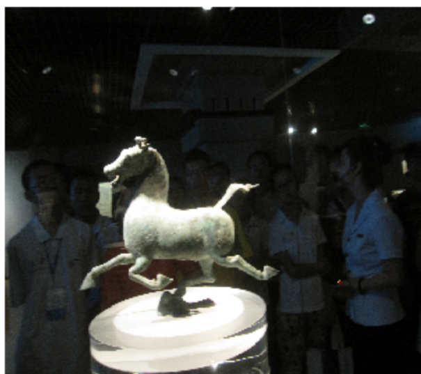
参观甘肃省博物馆