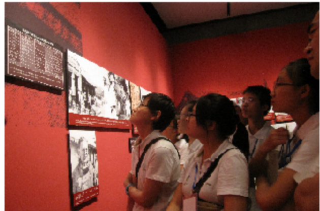
参观八路军兰州办事处纪念馆