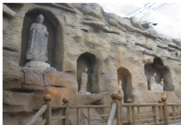
参观甘肃省博物馆

在这所综合性大学里,我感受到了浓厚的学术研究,科学探索的氛围,先进的科研成果。各位师生的不懈努力锻造了这样一所国内一流大学。兰州大学这所百年学府,处于古丝绸之路的重镇之地,让她深深地镌刻在历史的长河中,在前瞻之时,也希望我们也能沿着历史的脚步寻找她百年风采。