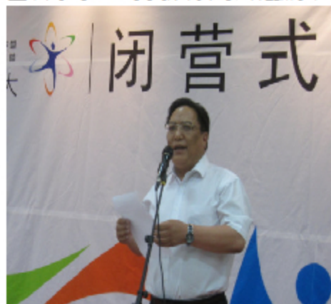
甘肃省教育厅副厅长 且智塔宣布闭营

科学营的活动虽然只有短暂的五天,但这场科普盛宴带给同学们的感受却是深刻的,开启了同学们的科学发现之旅,引领他们走进了神圣的科学殿堂。相信在未来的学习发展道路上,他们定会秉承严谨求实的科学态度,坚定立志从事科学研究的信念,保持不断进取的科研精神,为我国科学事业的发展续写辉煌篇章。