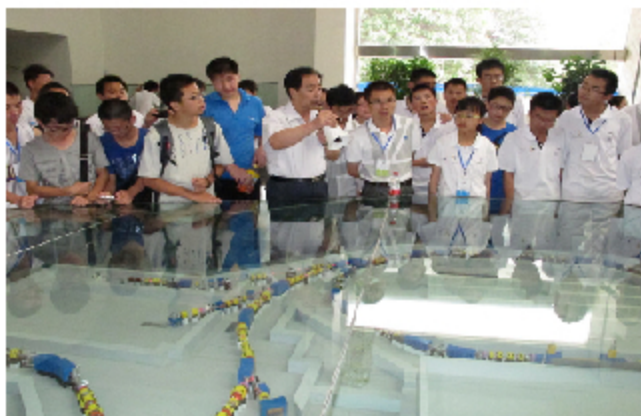
参观兰州重离子加速器国家实验室