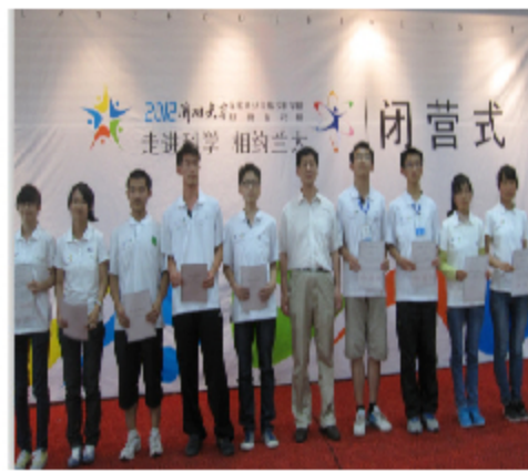
甘肃省科协副主席杨新科 为营员颁发营证书